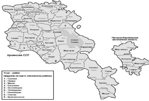
Harita 1. Sovyet Ermenistan'da ve Karabağ'da İdari Bölümler 45

Erivan şehri dâhil 11 taneye kadar azalmış ve Sovyet zamanında mevcut olan birçok rayon birbirleriyle birleşip başka bir rayon oluşturulmuştur.