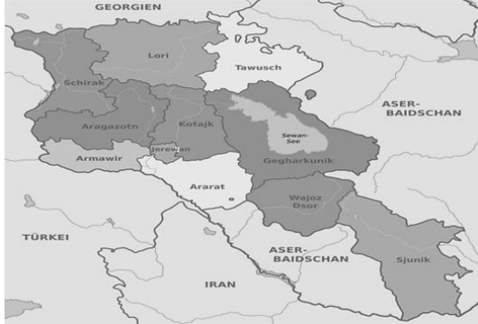
Harita 2. Günümüzde Ermenistan'da İdari Bölümler 46

Sovyet zamanında Ermenistan'ın diğer bölgelerine de büyük miktarda yatırım ve destek Moskova'dan geldiği için Ermenistan'ın her bölgesine düzenli şekilde idari hizmet verilmekteydi. 47 Ama Sovyetler Birliği dağıldıktan sonra Moskova'dan para akımı önemli derecede azalmış ve Ermenistan'ın maddi durumu büyük sıkıntıya düşmüştür. Ayrıca kırsal kesimdeki nüfusun ciddi şekilde azalması ve yaşlanmasından dolayı Erivan ve bazı rayon merkezlerinin dışındaki yerlerin nüfusu önemli derecede azalmıştır. Maddi sıkıntı ve nüfusun azalmasından dolayı ülkenin her yerinde düzenli idari hizmetin verilmesi oldukça zorlaşmıştır. Böylece bazı yerlerdeki kamu tesisleri ve idari hizmetleri birleştirip daha etkin idari hizmetleri vermek için rayonların sayısı azalmıştır.