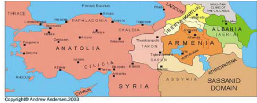
Harita 2- 600 yılına kadar genel hatlarıyla Roma-Armenia-Persia ve çevresi

ise Sasani kökenli Sasaniilere bağlı Chosroes (Hüsrev) tarafından yönetilmeye başlanmıştır. Yine de bölge insanı kendini hemen hiçbir zaman bu tür sorunlardan azade hissedememiştir. O dönemde Roma ve Sasaniiler için Ermenistan, coğrafi açıdan elde tutulması zor ve halkı da yerel özgürlüğe düşkün olduğundan, bölge ele geçirilmek yerine, her iki tarafın da sürekli mücadelelerinin çatışma alanı olmaya devam etmiştir. 60 Sasaniiler'in bölgeyi sık sık tedirgin eden saldırıları dışında, çevredeki Ermeniler'in, düşmanlarının dili olan Grekçeyle (Hellence) ibadet etmeleri ve bu dilde okuyup yazmaları, Sasani hükümdarları tarafından tehdit unsuru olarak algılandığından, Ermeniler arasında kutsal metinlerin yeni bir dille okunması ihtiyacını doğurmuştur. Hıristiyan din adamı Mesrobes Mashtots 405'te Ermeni alfabesini oluşturarak toplumu Sasani hükümdarların karşıt tavırlarından korumaya çalışmıştır. Bu, aynı zamanda Ermeni toplumunun ileride, Hıristiyan bir kimlikle varlığını koruyabilmesini sağlayan en önemli unsur olmuştur. 61