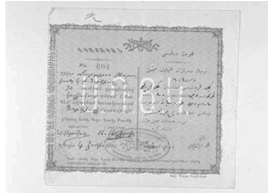
Belge 1: BOA.DH.EUM.ADL, 5/29-4