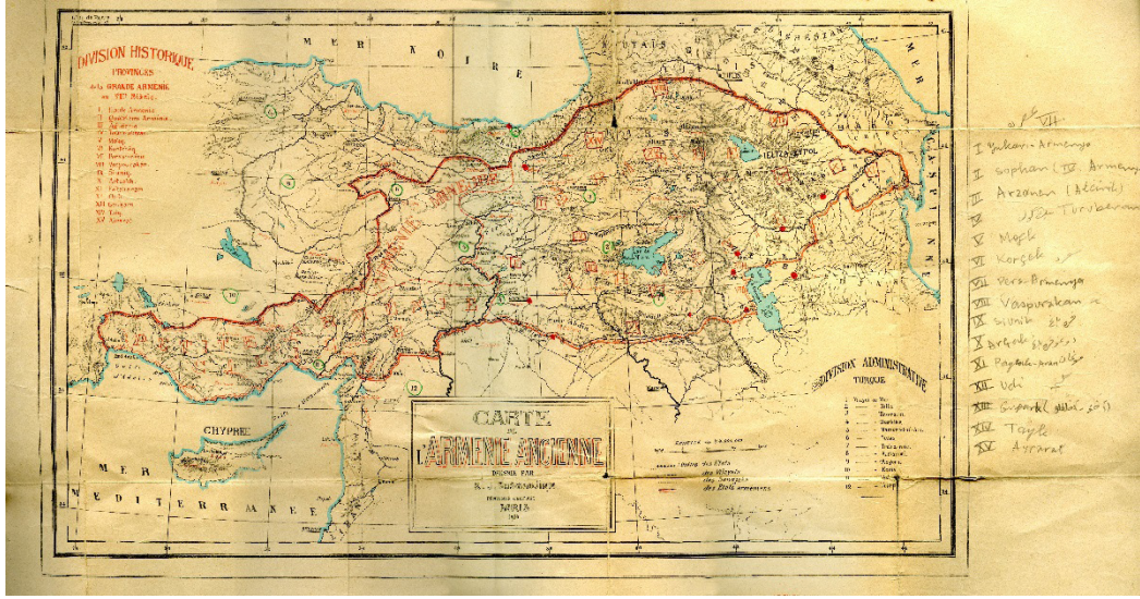
Bakü'den Antalya'ya harita